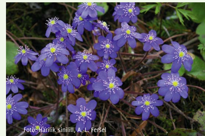
Foto: Harilik sinilill

Liigirikas on ka kaitseala linnustik (102 liiki). Toitumas on nähtud väikekajakat ( Larus minutus ), kiivitajat ( Vanellus vanellus ) ja sookurget ( Grus grus ). 18 kaitsealusest linnuliigist on alale iseloomulikumad raudkull ( Accipiter nisus ), mustviires ( Chlidonias niger ), roo-lookull ( Circus aeruginosus ), tamme-kirjurähn ( Dendrocopos medius ), hallpea-rähn ( Picus canus ), jõgitiir ( Sterna hirundo ). Viljandi lossipargi vanemas puistuosas elutsevad kodukakk ( Strix aluco ) ja väänkael ( Jynx torquilla ).