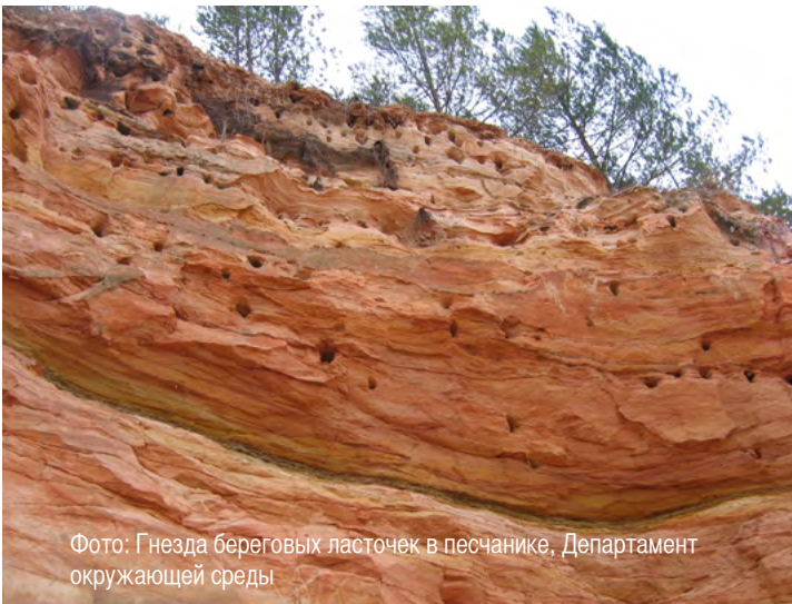
Фото: Гнезда береговых ласточек в песчанике, Департамент окружающей среды