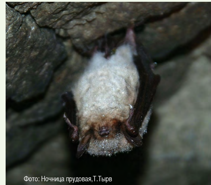
Фото: Ночница прудовая, Т.Тыров

Летучие мыши принадлежат к отряду рукокрылых. Представители этого отряда являются единственными млекопитающими, способными летать. Летучие мыши, обитающие в Эстонии, по ночам питаются насекомыми, которых они находят посредством восприятия ультразвука и его отражения. Дневное время они проводят в застывшем виде в дуплах и расщелинах деревьев или на чердаках зданий. Если некоторые виды летучих мышей (например, вечерница рыжая) улетают на зиму в теплые края, то, например, ночницы собираются в пещерах и подвалах и впадают там в зимнюю спячку, которая длится с октября по апрель. В это время летучие мыши живут за счет жира, накопленного в теле за лето. На время зимовки температура тела летучих