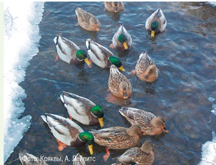
Фото: Кряквы, А. Лейвитс