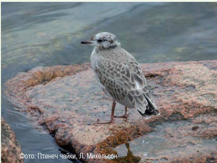
Фото: Птенеч чайки, Л. Михельсон

Если вам встретилось неподвижное животное, внимательно посмотрите, что может препятствовать его движению (например,