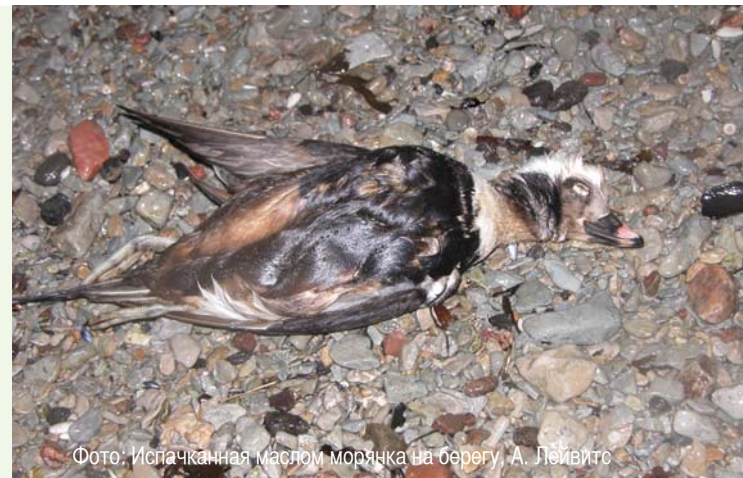
Фото: Испачканная маслом морячка на берегу, А. Лейвитс

веревка от стога сена, пластиковая бутылка, целлофановый пакет и т.п.). Если животное застряло, помогите ему высвободиться. При этом учитывайте, что животное может вас испугаться, и в ответ на вашу помощь начать сопротивляться и пытаться напасть. Чтобы не получить травму, не поранить животное и не заставить его еще больше нервничать, накройте животное любым предметом одежды, чтобы оно вас не видело. По возможности позовите кого-нибудь на помощь, чтобы один человек смог придержать животное, а второй – убрать предмет, за который оно зацепилось.