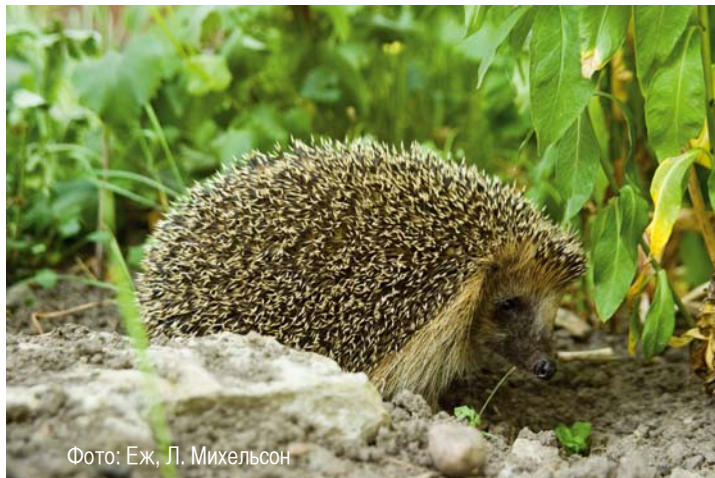
Фото: Еж, Л. Михельсон