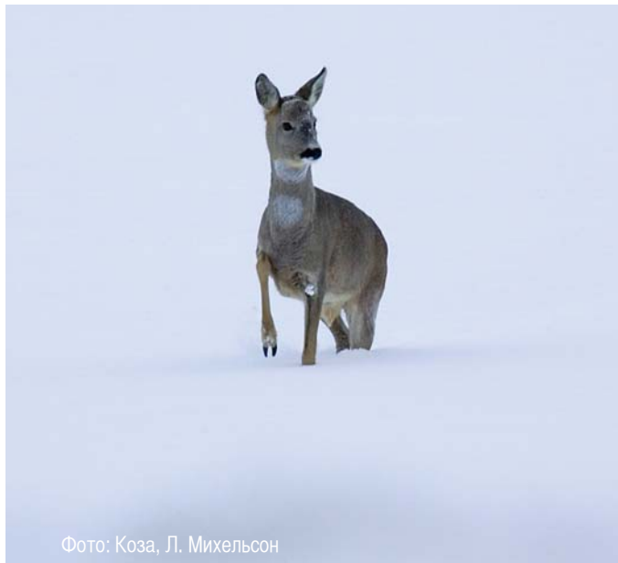
Фото: Коза, Л. Михельсон

Если вы считаете, что животное попало в беду и обязательно нуждается в помощи, то вы можете сообщить об этом в Инспекцию по защите окружающей среды по телефону 1313.