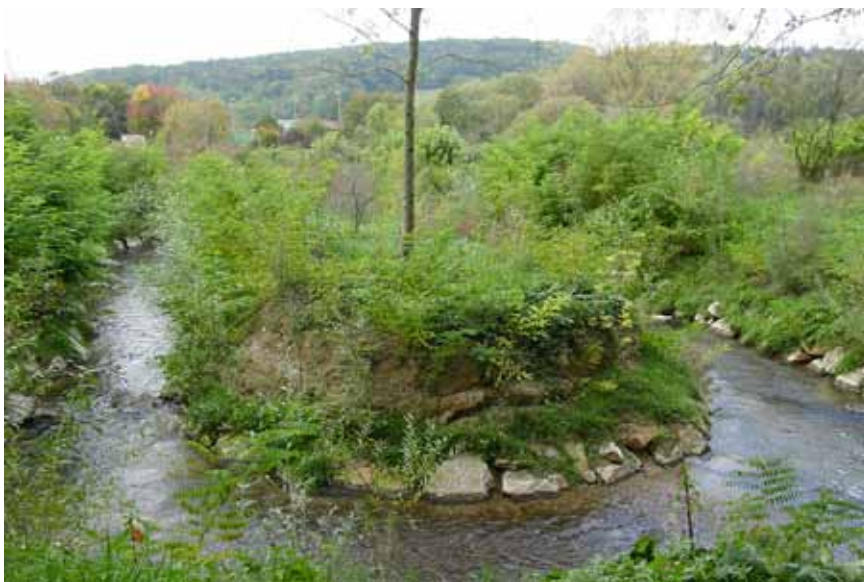
LIFE99 NAT/A/006054 (pärast)

Kõrvalkanali ehitamine Eibelsau ülevoolupaisule ja voolava vee ja taimestikuga kanal, mis võimaldab kaladel ülesvoolu liikuda.