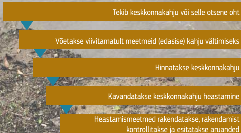
Joonis 1. Keskkonnavastutuse direktiivi rakendamine

Kaitsemeetmena on vabaühendustel ja kodanikel keskkonnavastutuse direktiivi järgi õigus teavitada pädevat asutust mis tahes keskkonnakahjust (või selle otsesest ohust) ja pädevate asutuste tegevust või tegevusetust vaidlustada, et tagada nende tegutsemine avalikkuse huvides, eesmärgiga keskkonnakahju vältida ja heastada. Keskkonnavastutuse direktiivi rakendamise protsessis osalevad ka muud osalised, nt kindlustusepakkujad, juristid, tehnilised eksperdid (ökoloogia, teaduse, riskihindamise, projekteerimise, keskkonnakahju heastamise, majanduse ja õiguse valdkonnas) (vt joonis 1).