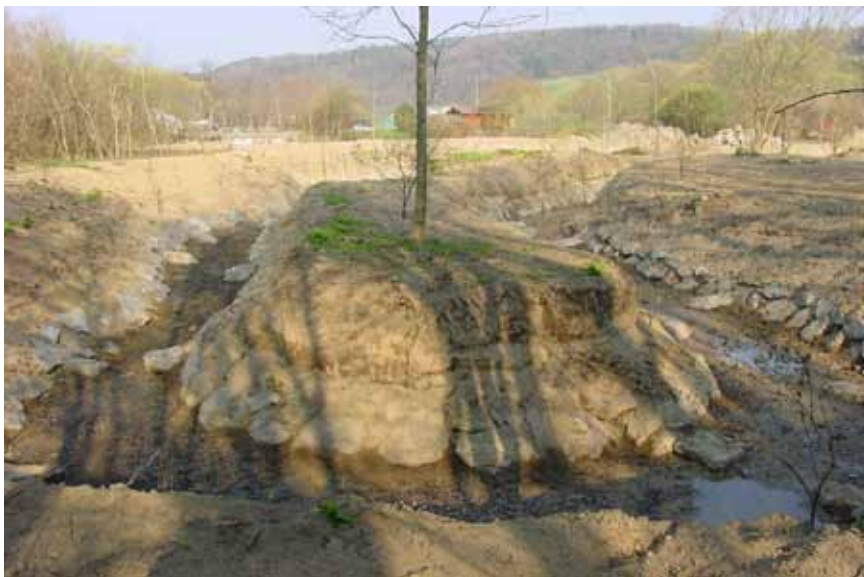
LIFE99 NAT/A/006054 (enne)

Kõrvalkanali ehitamine Eibelsau ülevoolupaisule ja voolava vee ja taimestikuga kanal, mis võimaldab kaladel ülesvoolu liikuda.