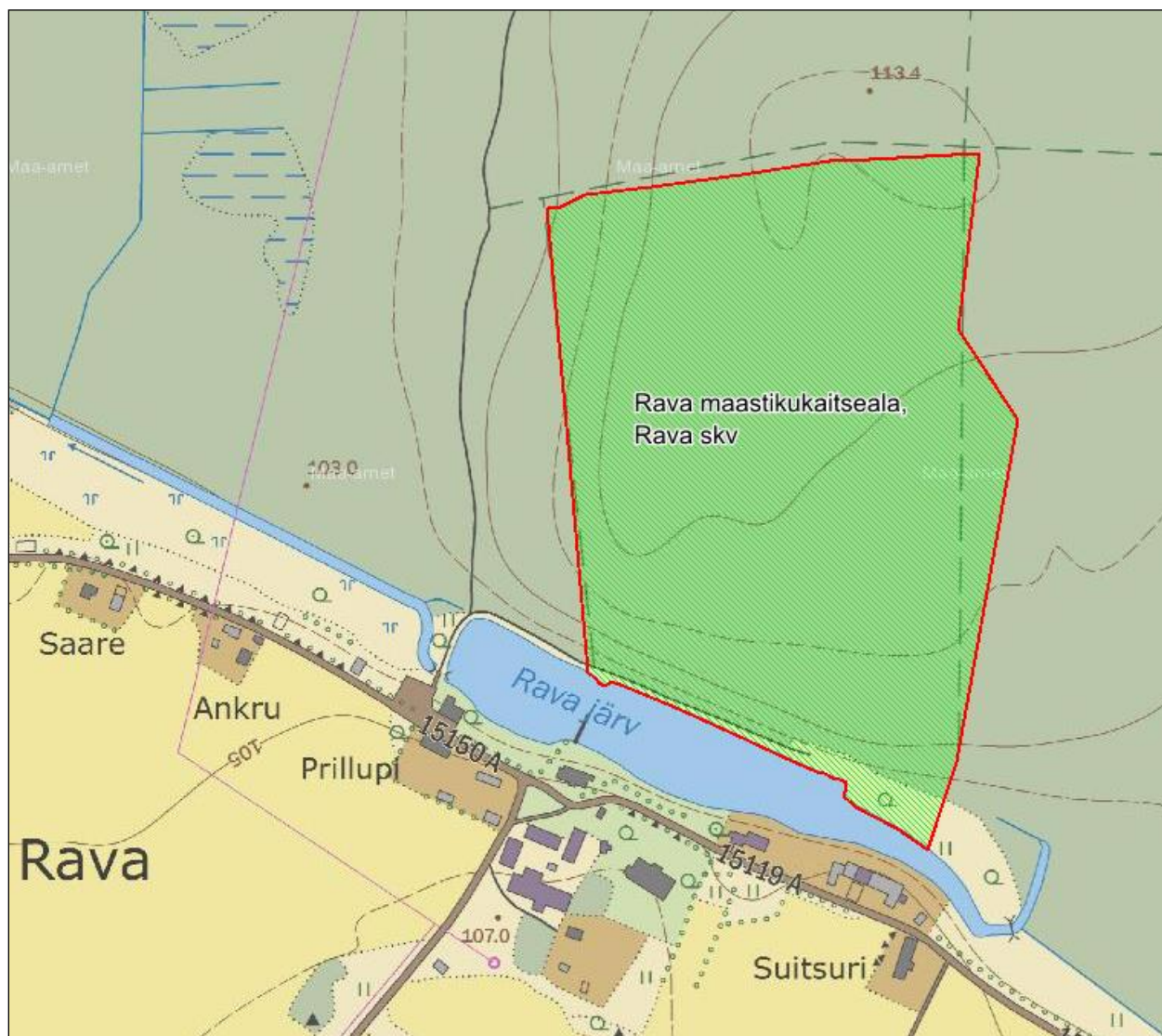
Joonis 1. Rava maastikukaitseala (aluskaart: Maa-amet).

Rava maastikukaitseala moodustati Vabariigi Looduskaitse Nõukogu 11. mai 1936. a otsusega kaitse alla võetud Rava tammede (oli Eesti Vabariigi tollases looduskaitseregistris esimene sissekanne) ja 1972. a moodustatud Rava tammiku kaitseala baasil 2000. aastal. Rava maastikukaitseala praegune kaitse-eeskiri kehtestati Vabariigi Valitsuse 23. jaanuari 2006. a määrusega nr 18 „Rava maastikukaitseala kaitse-eeskiri”. Kaitseala maa-ala kuulub tervikuna Rava sihtkaitsevööndisse.