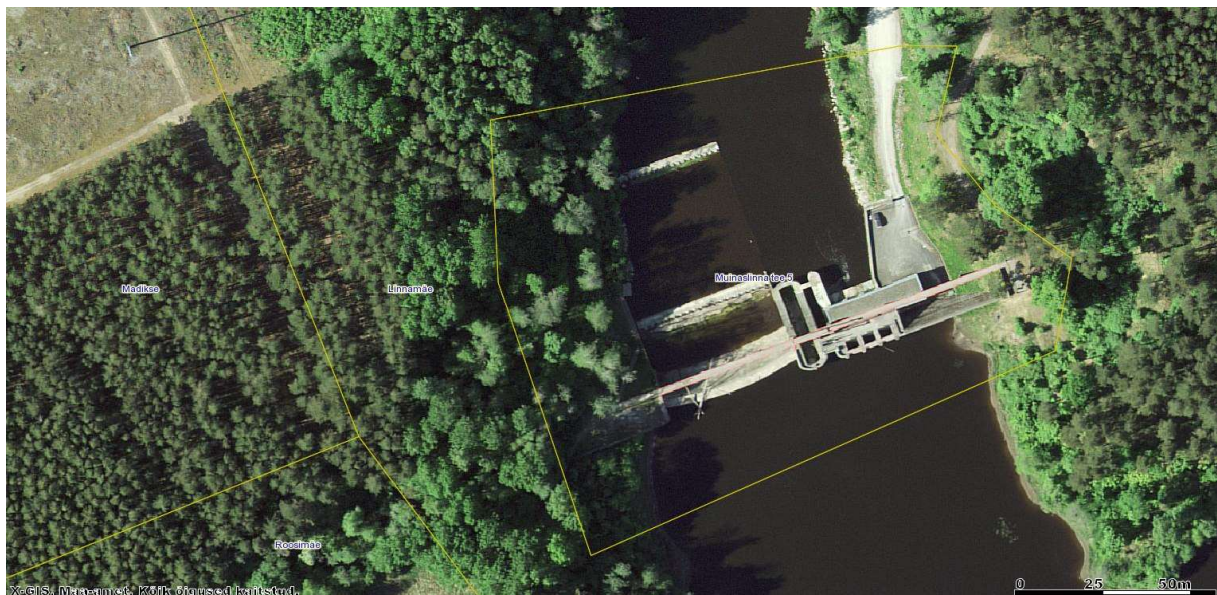
Joonis 1. Linnamäe HEJ paisu kavandatava tegevuse ala 28.05.2018 ( http://xgis.maaamet.ee )

Linnamäe pais ja hüdroelektrijaam kuulub käesoleval ajal läbi kinnistu tähtajalise hoonestusõiguse (kehtib veel 81 aastat) Wooluvabrik OÜ-le. Kinnistu kuulub Jõelähtme vallale.