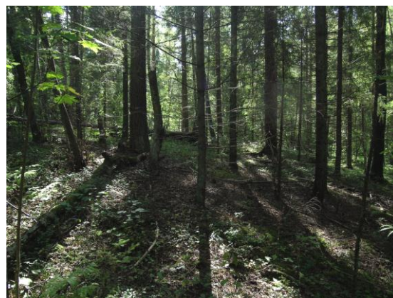
Metsad Prandsumõtsa massiivis.